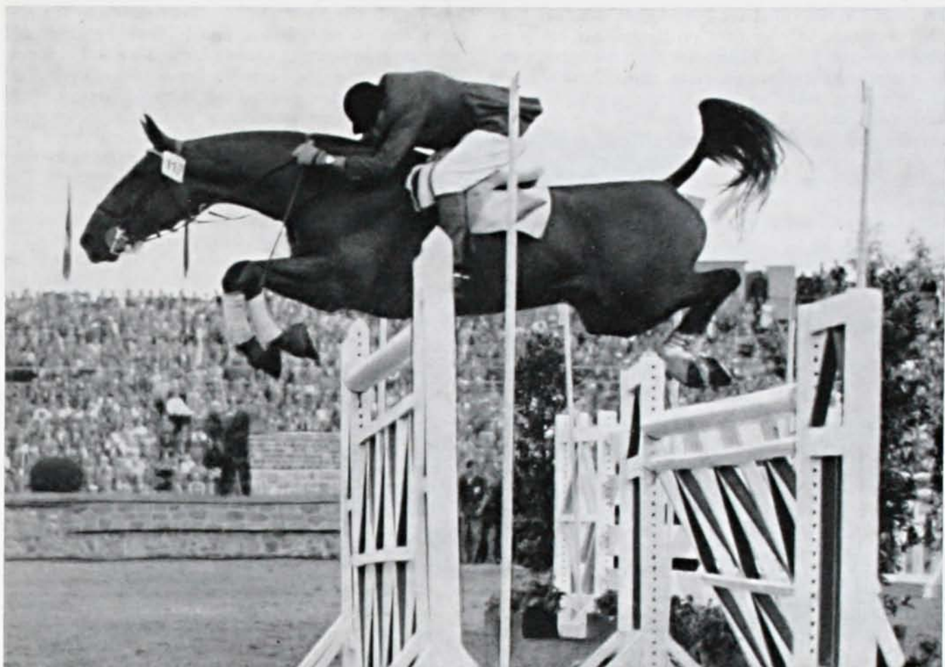
FRANCISCO GOYOAGA, Spanien på Fahnenkönig, Verdensmester 1953. – Pacos ridning har altid været præget af et kolossalt driv, og man føler, ved at se på dette billede, at rytteren kunne drive en hest gennem en mur. Hans sæde er stærkt og godt og Paco har foldet sig selv sammen i stedet for at lægge sig fremover. Han bliver derfor midt på sin hest. Paco viste altid sine heste vejen – fremad – og hans hænder er netop så følsomme, at hesten får mulighed for at bruge sin hals og ryg over den brede forhindring.

vor hånd». Holder vi igen, så snart den øger farten, eller indskyder vi et par halve parader, som vi ville gøre hjemme, går det flydende i hele forestillingen tabt. Hvis vi derimod intet foretager os, begynder hesten måske at springe dårligt eller endog farligt. Under disse omstændigheder vil den gode rytter vælge en middelvej, idet han mere påpegende end insisterende forsøger at »overbevise« hesten om nødvendigheden af et fornuftigt tempo.