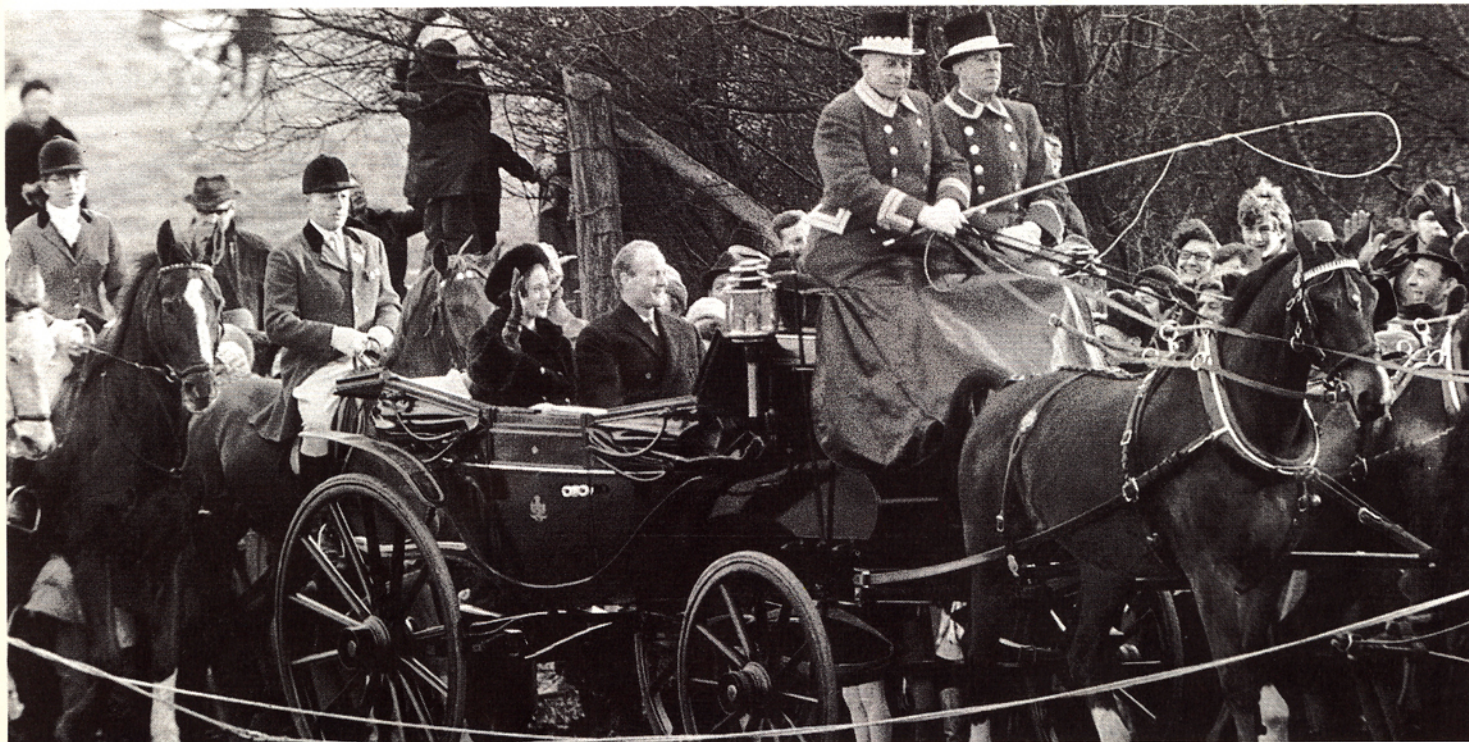
En januarsøndag for 25 år siden hentede 72 rødjakkede ryttere det kommende brudepar ved Tre Pile-lågen og eskorterede kareten til Eremitageslottet. Her var resten af kongefamilien samlet for at overvære en flot kvadrille med voltefigurer som hjerter.