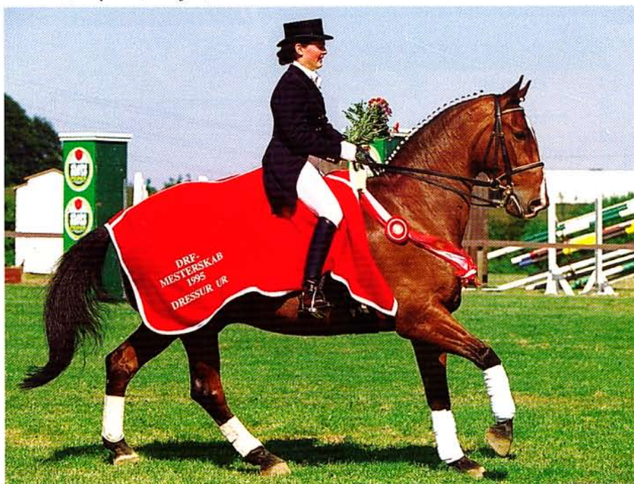
Fie Skarsø/Surprise. (Foto: JBR).

Vallensbæk Ridecenter danner i dagene 19.-23. juni ramme om europamesterskaberne i dressur for junior- og ungrytter. Der kæmpes hårdt om pladserne på de to landshold, og endnu ved vi ikke, hvem der skal repræsentere de danske farver. Ridehesten-Hippologisk giver her og også i juni nummeret en præsentation af sandsynlige emner. Den første rytterpræsentation kommer her.