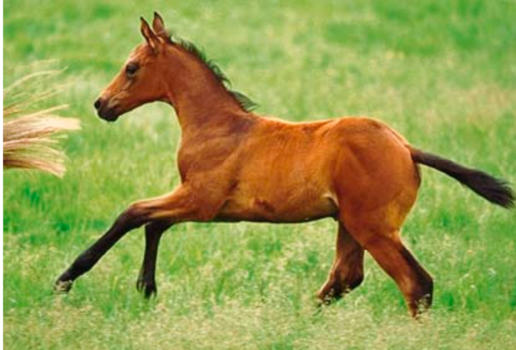
Årets Ram-A-Jean-føl på Øxenholm, Jean de France. Moderen er fuldblodshoppen Carus-