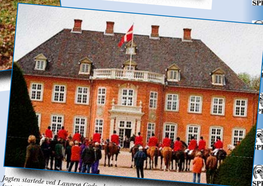
Jagten startede ved Langesø Gods - hvor der blev budt på en velkomstdrink - inden feltet fortsatte ud i forårsskoven.