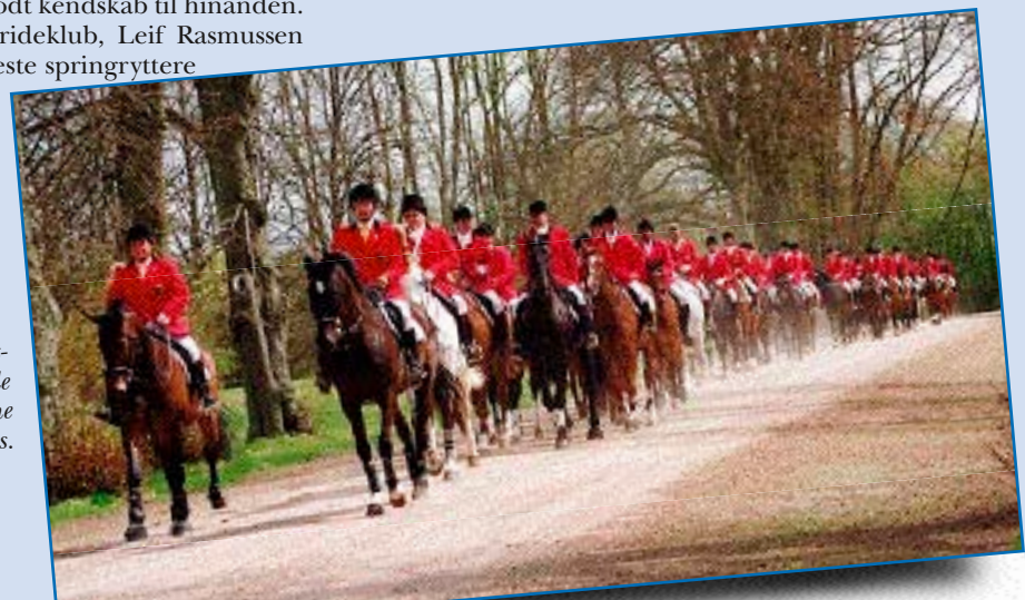
Næsten 80 forventningsfulde jagtryttere fra hele landet på vej ud i skovene ved Langesø Gods.