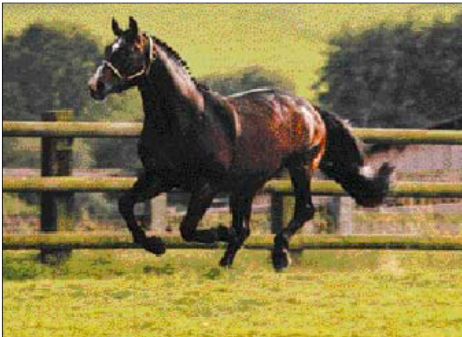
En af de mest berømte sønner efter Almé; I Love You.

Almé til Zangersheide Almé blev på trods af en sparsom benyttelse som avlshingst i sine unge år far til flere betydningsfulde sønner i Frankrig,