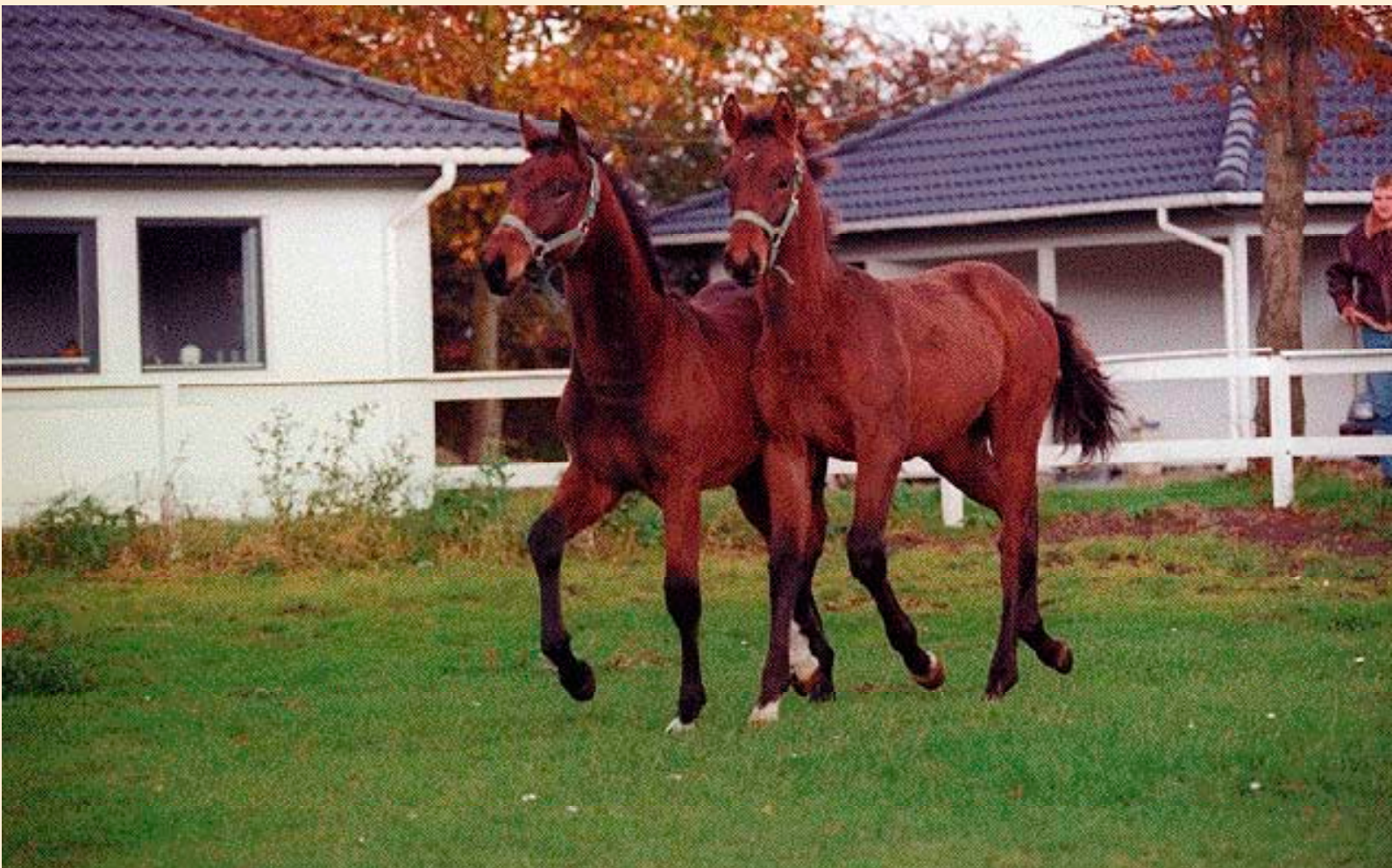
Føllene Santano og Come Back munter sig i folden foran den nye villa, som familien tog i brug i sommer efter i en periode at have haft bolig og heste to forskellige steder.