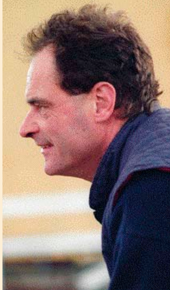
- Enten ved man noget, og så må man stå ved det, eller også ved man ikke noget, og så skal man da ikke udbrede det.

- Jeg synes også, at man i DV kan have for svært ved at glemme gammelt nag, fx. i relation til hingsteholderforeningen. Er der lavet fejl en gang, må man tale ud om